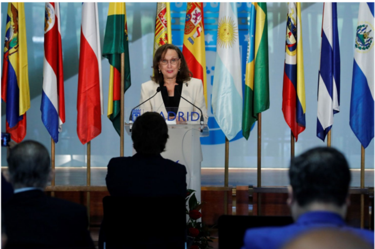
La secretaria general iberoamericana, el viernes pasado en Madrid.

La secretaria general Iberoamericana pide poner al continente “en el centro” de la agenda de los organismos internacionales para impulsar la recuperación de la peor crisis desde que hay registros