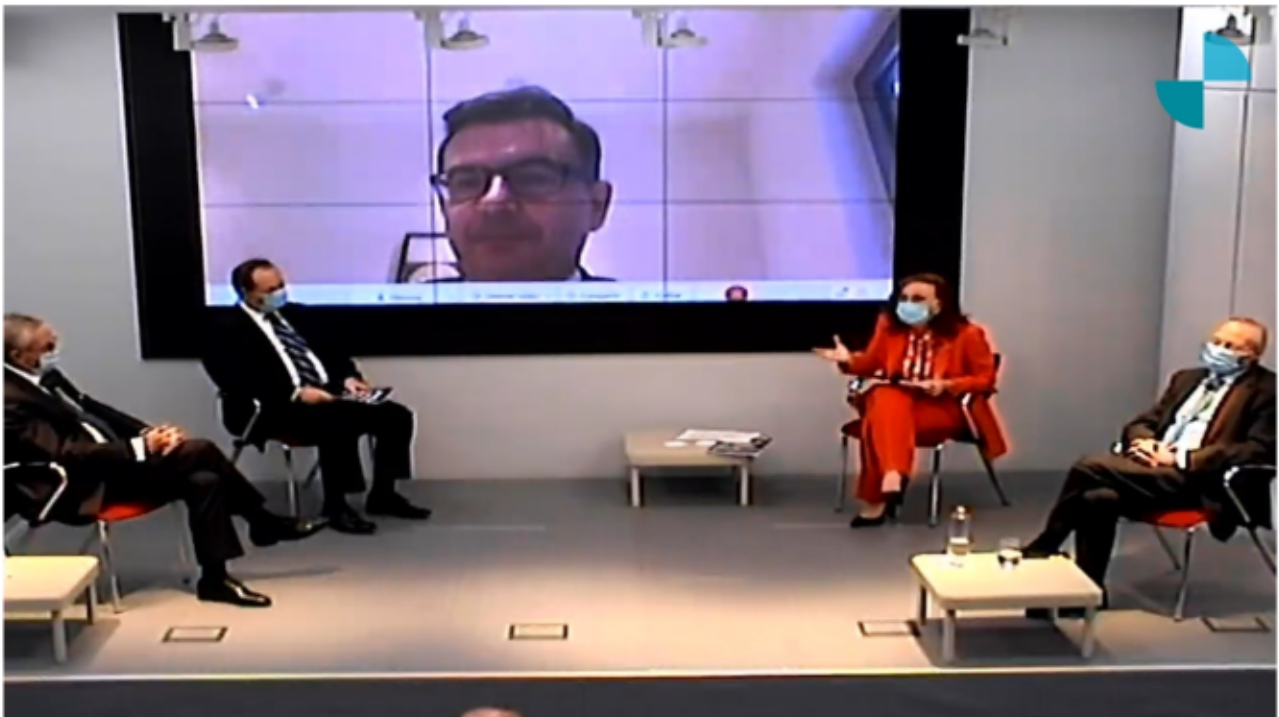
Presentación del informe “América Latina, una agenda para la recuperación”

Los paquetes de medidas fiscales puestos en marcha con este objetivo , que en promedio representan cerca del 4% del PIB de la región, y los menores niveles de recaudación derivados de la crisis han aumentado de forma significativa (alrededor del 5% en promedio) los déficits primarios de las economías latinoamericanas. A su vez, estos déficits se están financiando con mayores niveles de deuda, que se espera aumente, de media, alrededor de 10 puntos de PIB al final de este año.