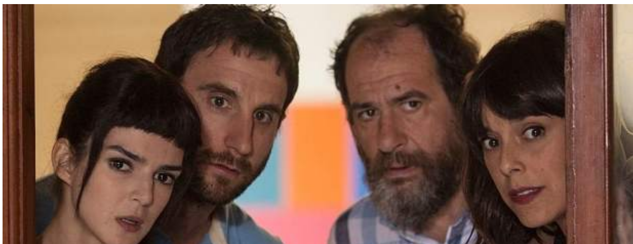
Fotograma de la película "Ocho apellidos catalanes".