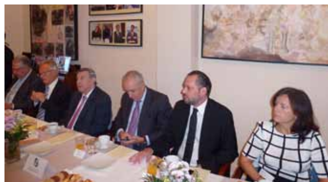
Línea de invitados, entre ellos, el embajador

El ex canciller habló a continuación de las próximas elecciones generales que tendrán lugar en Perú, en abril del 2016, y destacó la excelente ubicación geográfica, así como las buenas relaciones con los otros países de la región, tanto desde el punto de vista político como económico.