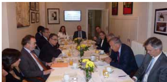
Invitados al desayuno-coloquio