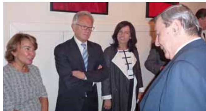
Conversación previa al desayuno-coloquio