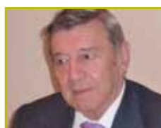
Rafael Roncagliolo, Embajador de Perú en España -8 de octubre-