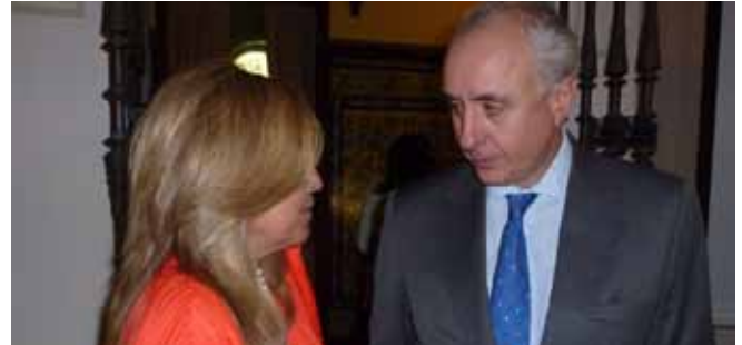
Trinidad Jiménez y Pablo Gómez de Olea