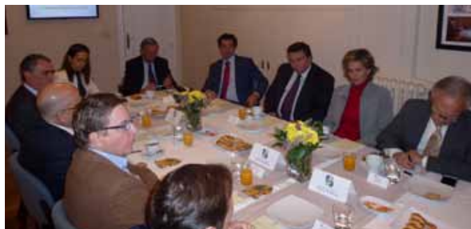
Dos planos de la mesa con los invitados