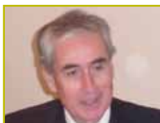
Ramón Jáuregui, Copresidente de la Asamblea Parlamentaria EuroLatinoamericana / EuroLat -26 de octubre-