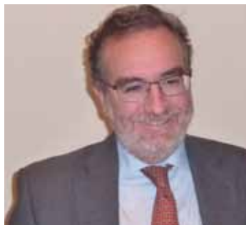
Felipe de la Morena

Ya nadie cuestiona los efectos adversos del aumento de los gases de efecto invernadero como consecuencia de la intervención del hombre, señaló el embajador De la Morena , para luego hacer un resumen de los avances desde la cumbre