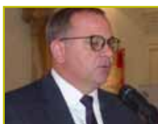
Eugenio Martínez, Embajador de Cuba en España -17 de septiembre-