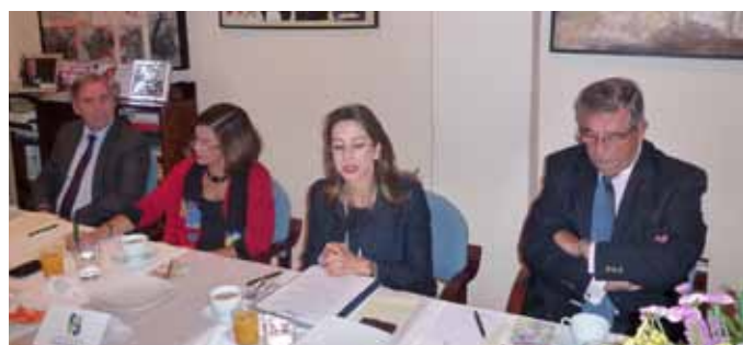
Linea de invitados al desayuno