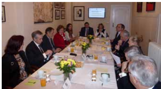
Invitados al desayuno-coloquio