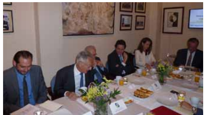
Planos generales de los asistentes