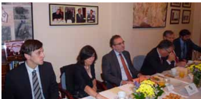
Invitados al desayuno-coloquio. En el centro, el embajador De la Morena

de la Tierra de Río de Janeiro hasta la COP20 (Conferencia de las Partes de la Convención Marco de las Naciones Unidas sobre el Cambio Climático), en Lima (2014), donde se recogió el compromiso de reducción de gases del efecto invernadero y, entre otras cosas, se consideró necesario un cambio de modelo económico, de producción y del consumo. El siguiente y definitivo paso será la celebración de la COP 21 en París (30 noviembre-11 diciembre) que debe concluir con un acuerdo sobre el clima, global y vinculante jurídicamente para todos los países firmantes, con el objetivo de mantener el calentamiento global por debajo de los 2 grados.