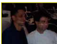
Amit Sood, Director of the Google Cultural Institute -1 de octubre-