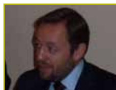
Francisco de la Torre, Candidato de Ciudadanos por Madrid -22 de octubre-