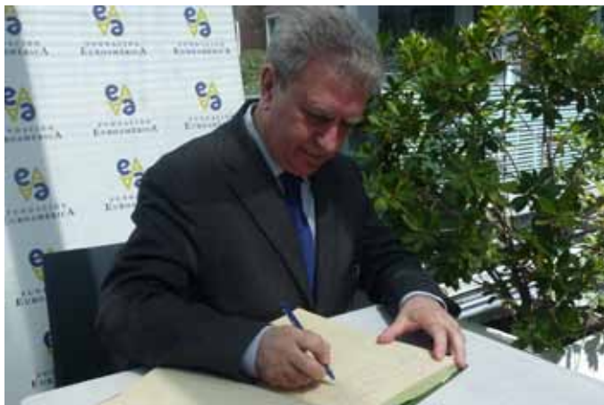
Cesar Antonio Molina firma en el libro de honor