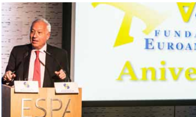
Intervención del Ministro de Asuntos Exteriores y de Cooperación, José Manuel García-Margallo