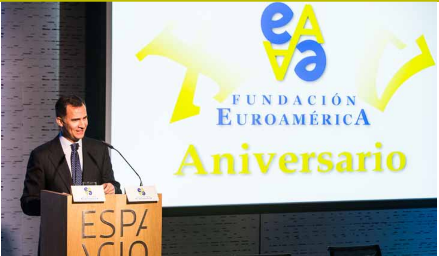
S.A.R. el Príncipe de Asturias interviene en el acto de celebración del XV Aniversario