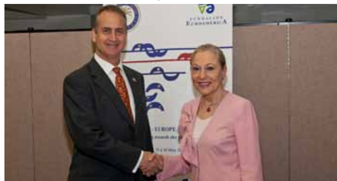
Congressman Mario Diaz-Balart y Benita Ferrero-Waldner