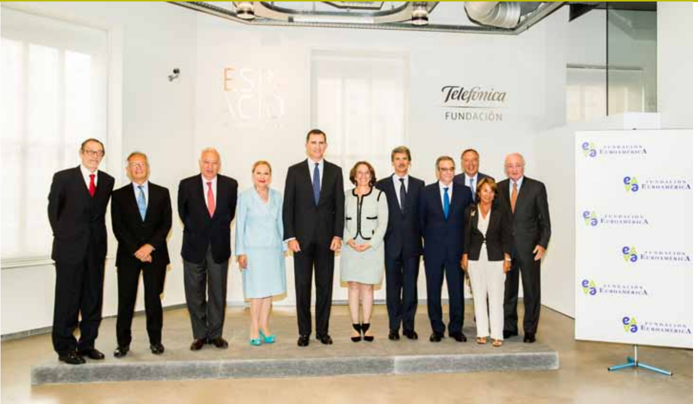
Foto de familia