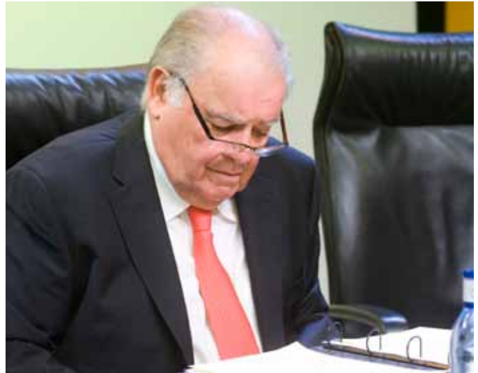
Enrique V. Iglesias, durante la inauguración de uno de nuestros foros

En 2003, el Secretario General de la ONU, Kofi Annan, nombró a Enrique V. Iglesias miembro de la Comisión de Alto Nivel para evaluar las amenazas a la paz y a la seguridad mundial, así como la reforma de la ONU. En 2005, Annan volvió a contar con Iglesias como experto mundial