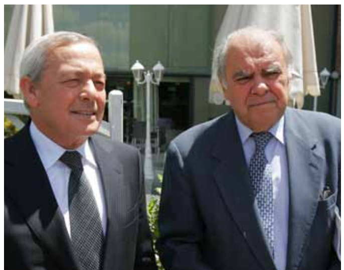
Enrique V. Iglesias y Carlos Solchaga, Presidente de honor de la Fundación Euroamérica

Iglesias nació en Asturias, España, y es ciudadano naturalizado uruguayo. Se graduó en Economía y Administración en la Universidad de la República de Uruguay en 1953 e hizo estudios superiores de especialización en Estados Unidos y Francia.