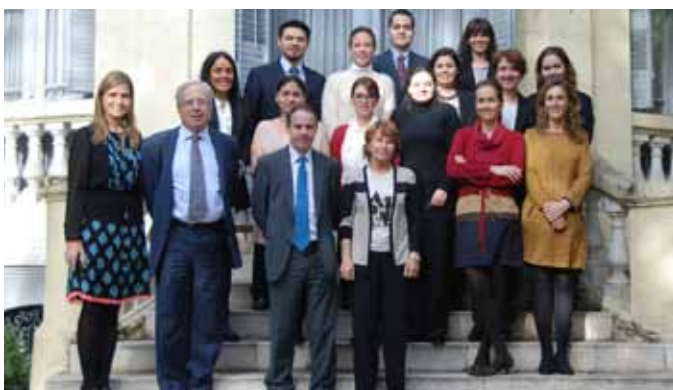
Becarios del Centro de Estudios Garrigues y directivos del Centro, de la Asociación de Becarios y de la Fundación