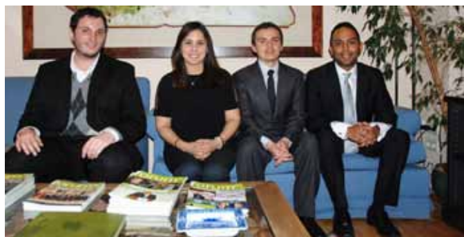
Becarios del IE Business School